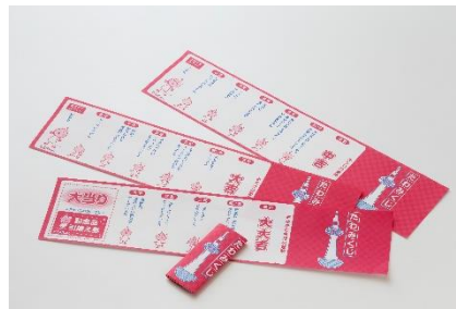
▲たわみくじ(たわわちゃんのおみくじ)